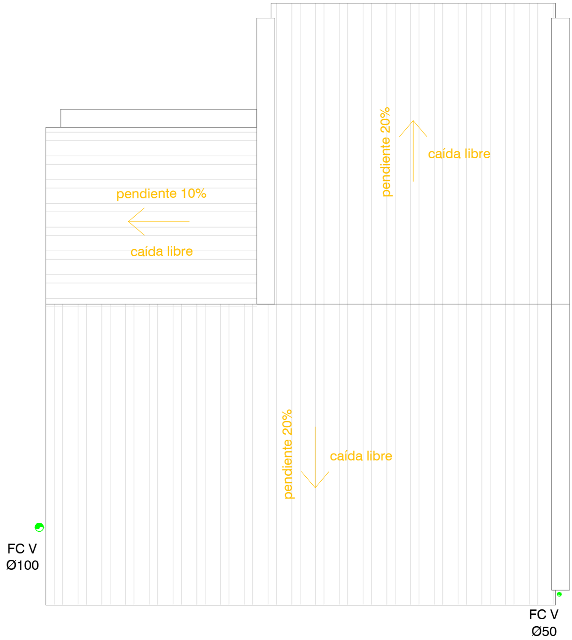
2N 4D der